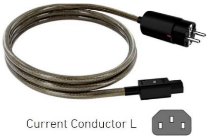
Current Conductor L