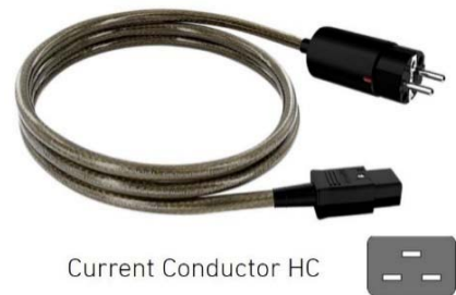
Current Conductor HC