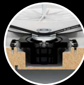
Superbe suspension moteur : aucun point de contact