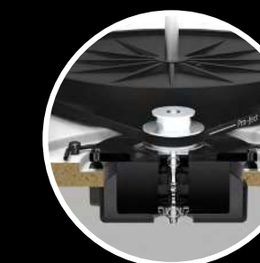
Suspension moteur Silicon-damped Motor Suspension