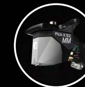
Cellule : Pick it S2 MM