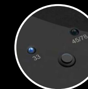
Changement de vitesse électronique