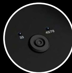
Changement de vitesse électronique