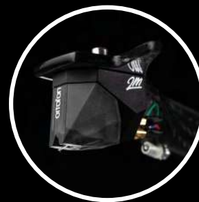
Cellule : Pick it 2M Silver