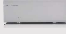
M8-S 500s | AMPLI DE PUISSANCE

C’est le digne héritier du Titan, déployant une qualité sonore semblable, une clarté et des dynamiques exceptionnelles. Le M8-S 700m est capable de créer une immense scène sonore quasiment holographique dans son amplitude et sa profondeur. Qu’il s’agisse de l’enregistrement acoustique le plus intimiste ou une œuvre orchestrale bien plus conséquente, le curseur de performance est idéalement placé et ne laisse jamais ressentir la moindre limite. Apparez-le avec notre préampli phono M8-S PRE complémentaire pour bénéficier d’une superbe amplification adaptée à n’importe quel système.