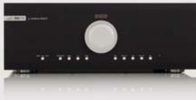
M8-S PRE | PRÉAMPLI SYMÉTRIQUE

Le M8-S PRE n’a pas de limite. De sa performance à sa connectivité en passant par sa finition de qualité, cela en fera le cœur exceptionnel d’un peu près n’importe quelle chaîne HI-FI.