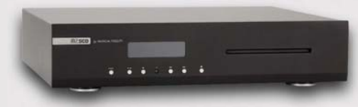
M2-S CD | LECTEUR CD