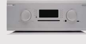
M8-S Encore 500 | STREAMER

Le M8-700m a obtenu de remarquables critiques et un accueil très enthousiaste de la part d’audiophiles qualifiés. La combinaison d’une technologie de pointe et d’une puissance élevée s’avère en effet particulièrement convaincante. Cependant tous les utilisateurs n’ont pas forcément la place de mettre deux amplis monos chez eux. C’est pour eux que nous avons conçu le M8-500s, un ampli de puissance stéréo. L’appareil au préampli M8s permettra d’obtenir un système d’amplification à la reproduction sonore du meilleur niveau.