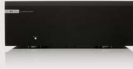
M8-S 700m | AMPLI DE PUISSANCE MONO

Nous sommes tellement confiants quant aux capacités du M8-S que nous pouvons affirmer qu’il pilotera n’importe quel ampli de puissance via n’importe quelle longueur de câble. Bien sûr, son partenaire idéal reste l’ampli de puissance mono M8-S 700m.