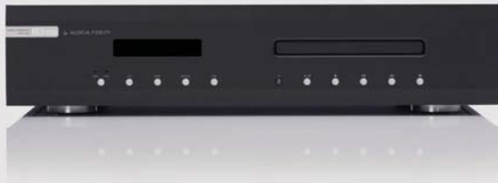
M3-S CD | LECTEUR CD

Tout comme l'ampli intégré M3-Si compatible, le M3-S CD a été conçu comme de la hi-fi de qualité supérieure pour un prix modeste. Le M3-S CD dépasse les attentes tant par la finition soignée de son châssis métallique que par la technologie unique qui se trouve à l'intérieur.