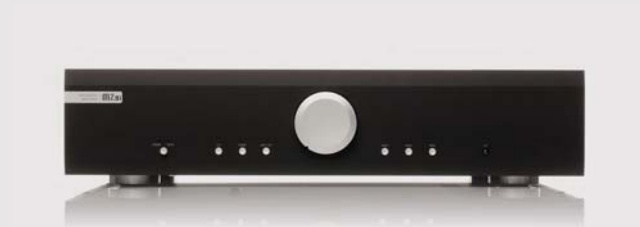
M2-Si | AMPLI INTÉGRÉ

Le DAC du M2-S CD s'inspire également de ses pairs haut-de-gamme, utilisant une technologie de pointe permettant la lecture optimale des données enregistrées sur vos disques. Pour faire simple, vous allez redécouvrir votre musique !