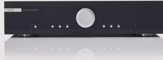
M3-Si | AMPLI INTEGRÉ

Nous, nous disons de lui que c'est un lecteur à l'esthétique et aux sonorités magnifiques que vous devez absolument voir... et écouter.