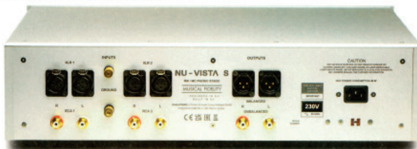
Les deux entrées phono RCA doublées XLR ont chacune leur borne de masse. À ce haut niveau de qualité, mieux vaut utiliser un câble symétrique XLR en provenance du bras, pour profiter pleinement de l'architecture du Vinyl S.