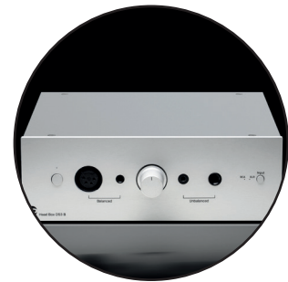
Boîtier premium entièrement métallique, gage de robustesse et de durabilité