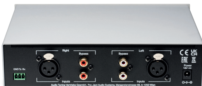
Head Box S3 B