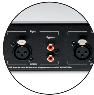
Chaîne du signal entièrement symétrique, des entrées RCA & XLR jusqu'aux sorties casque