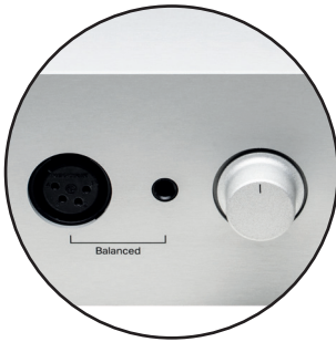
Sorties casque symétriques : 4,4 mm & XLR